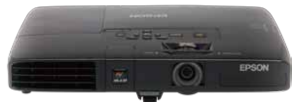
EPSON EB-C3000X 多媒体液晶投影机