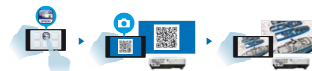
* IOS 系统支持 Word/Excel/PowerPoint/Apple keynote/PDF/JPEG/PNG 文件 Android 系统支持 PDF/JPEG/PNG 文件

“iProjection” 可以实现用户将智能设备中文件无线传输, 适用于配备网络功能的爱普生投影机, 是实现智能投影的高效解决方案。